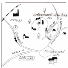
trať č. 072; žst. Ústí na Labem - Stěkov; 1,6 km

Severovýchodním směrem brání ve výhledu z otevřeného ochozu ve výšce 7 metrů vrcholky vzrostlých stromů (Ústí nad Labem s rozhlednami Větruše a Erbenova vyhlídka, Krušné hory s Komáří vížkou). Od hlavního nádraží přejedeme Labe přes železný most Edvarda Beneše a na kruhovém objezdu se dáme doprava. První ulicí odbočíme vzápětí doleva a přes železniční trať projedeme areál Setuzy. Ulice Žukovova nás prudkým stoupáním zavede na Novosedlické náměstí, odkud pokračujeme stále po zelené doleva. Po 150 metrech značka uhýbá doleva na schody. Cyklisté musí pokračovat ještě necelou stovku metrů a odbočit první ulicí (Skřetovou) doleva a pak opět do-