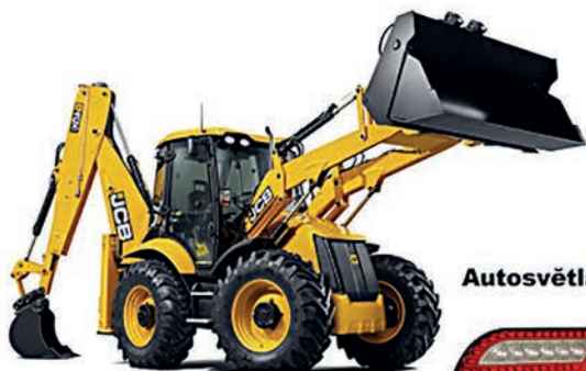
Alternátory - startéry