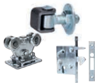
Příslušenství pro brány