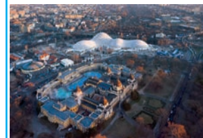
Termální lázně v Budapešti

O tom, že je Maďarsko evropskou lázeňskou velmocí dozajista nikdo nepochybuje. Léčivou sílu pramenů bohatých na minerální látky si tu prý užívali už v pravěku. Není se čemu divit, každý, kdo někdy okusil léčivé účinky zdejších pramenů, dokonale servis zdejších lázeňských domů i pestrou paletu doplňkových služeb, se sem dozajista jednou rád vrátí. Kouzlo maďarských lázní si můžete užít i když vás zrovna netrápí žádné zdravotní neduhy. Rozlehlé lázeňské pavilony myslí i na mladé páry a rodiny s malými dětmi. Ty nejhonosnější lázeňské domy se nachází přímo v maďarské metropoli. Budapešť je právem považována za světové hlavní město lázeňství. Na území hlavního města vyvěrá více než 100 termálních pramenů, jejichž léčivé účinky vás dokonale připraví na další poznávání této rozmanité země. Největší radostí pro rodiče jsou dítká unavená celodenním řáděním ve vodě.