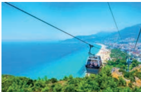
Lanovka nad Kleopatřinou pláží

V nejnavštěvovanějším tureckém letovisku nuda rozhodně nehrozí. Stačí si stopnout dolmuš a nechat se vysadit u některého z vyhlášených nočních klubů, užít si vodní sporty na proslulé Kleopatřině pláži, prohlédnout si letovisko z ptáčích perspektiv z bezpečí lanovky Teleferi Alanya, zadovádět si v moderním aqua parku, shlédnout delfíní show, vystoupat k branám městské pevnosti ze 13. století nebo se nechat opájet křehkou nádherou krápníků v jeskyni Damlatas.