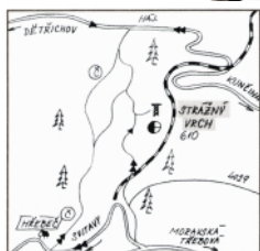
traf. č. 017; žst. Mladějov na Moravě; 7,7 km

Atypická sedmnáctimetrová dřevěná rozhledna z roku 2010, která svým tvarem symbolizuje výztuhu hornické štoly. Půlkruhový výhled východním směrem ze zastřešeného ochozu ve výšce 14 metrů (Moravská Třebová, Boskovická brázda, východní Orlické hory, za dobré viditelnosti i Králický Sněžník). K rozhledně vedou 3 hlavní přístupové cesty. Jednoznačně nejlepší je široká vozová cesta z Dětrichovské hájenky ležící na sedle silnice z Kunčiny do Dětrichova. Měří necelé 4 kilometry a vede jen do mírného kopce. Z opačné strany se lze k rozhledně dostat z hlavní silnice Moravská Třebová-Svitavy. V místě, kde z nové silnice odbočuje původní, která se velkým obloukem zařezává do mohutného hřebene, se po cyklostezce 4029 dostaneme po kilometru k rozcestí, na kterém odbočíme do kopce doleva a po 600 metrech překonáme úzkorozchodnou železnici. Odsud začíná téměř tříkilometrové prudké, místy až příkré stoupání, které nás neomylně zavede na vrchol.