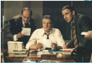
Případ mrtvých spolužáků film 22.35