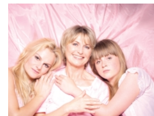
Tři holky jako květ