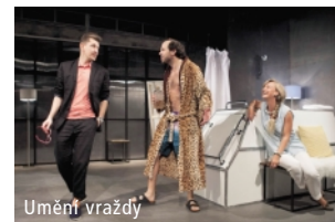
Změna programu vyhrazena!