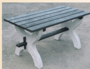
Zahradní stůl 2350,-