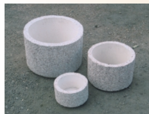
Nádoby na květiny 160,- až 2100,-

3K Kapr Provozovna: Loza, 331 52 Dolní Bělá | mobil: 604 473 470 www.3kkapr.wz.cz