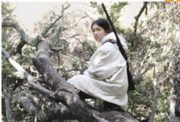
Stíny nad jezerem 23.35 seriál