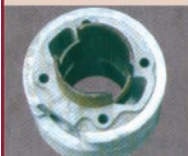
výbrusy válců, broušení hlav a bloků

PRO MOTOCYKLY, OSOBNÍ I NÁKLADNÍ AUTOMOBILY A PRACOVNÍ STROJE