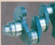
Protáčení a pouzdrění uložení hřídelí