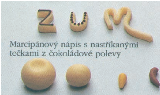
Marcipánový nápis s nastříkanými tečkami z čokoládové polevy