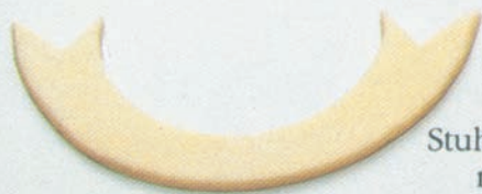
Stuha na nápis

Z marcipánu, vyváleného na různou tloušťku, můžeme modelovat nejrůznější figurky