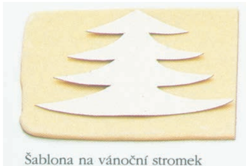
Šablona na vánoční stromek