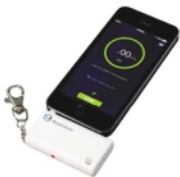
Alkoholtester pro smartphone