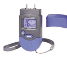
Měřič vlhkosti dřeva a stavebních materiálů