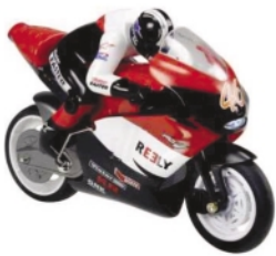
Dálkově ovládaný model