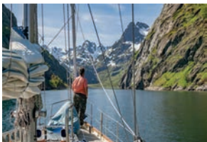
Plavba v Trollfjord, Norsko