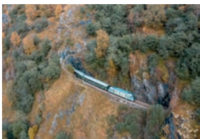
Železniční trať v Aurlandsfjord, Norsko

Za vaši pozornost rozhodně stojí i 29 km dlouhý Aurlandsfjord. Přiblížit se sem můžete pomocí ikonické norské železnice Flåmsbana, která je považována za jednu z nejkrásnějších vlakových tratí světa. I tady však platí to, že fjord nejlépe poznáte přímo z vodní hladiny. Mezi městečky Flåm a Gudvangen pendlují dva nejnovější norské trajekty, z jejichž paluby si dokonale užijete nádhernou ubíhající krajinu. Dala by se přirovnat k přírodnímu divadlu, vystavujícímu dramatický terén a horské štíty, hned vedle půvabných osad.