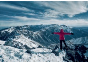
Pohoří Atlas v Maroku Pohoří Atlas v Maroku

Maroko mnoho z nás zná jako lákavou exotickou destinaci plnou rozsáhlých pouští a historických míst, kde se příjemně ohřejete i v zimních měsících. Neuděláte však chybu, pokud s sebou na cestu na černý kontinent přibalíte svou zimní výbavu. Pohoří Atlas totiž každoročně vítá africké milovníky zimních sportů i lyžařské nadšence z celého světa. Přijďte objevit kouzlo sjezdovek v nejvyšše položeném středisku Afriky, dost možná budete překvapeni, jak příznivé mohou být sněhové podmínky poblíž horké Sahary.