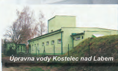
Úpravná vody Kostelec nad Labem

Spolupracujeme při projednání dotací všech titulů - vodohospodářských, stavebních, silničních i zelená úsporám.