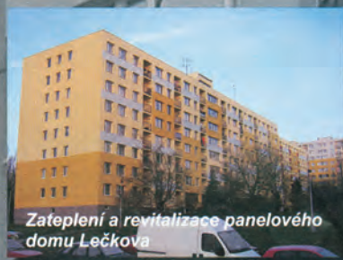
Zateplení a revitalizace panelového domu Lečkova