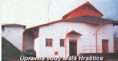
Úpravná vody Malá Hraštica