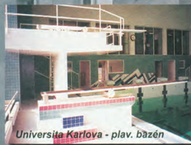
Universita Karlova - plav. bazén