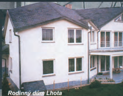
Rodinný dům Lhota

FIALA PROJEKTY s.r.o. Lečkova 1521, Praha 4, 149 00 ITel.: 606 69 21 02, 607 88 77 18 272 91 95 39, 272 91 30 20 Fax: 272 94 13 74 E-mail: projekty@fialaprojekty.cz