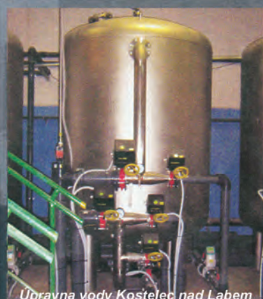
Úpravná vody Kostelec nad Labem