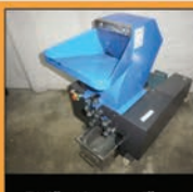
Drtiče plastu a dřeva

Seno, sláma, piliny, hobliny, obilí, kukuřice, otruby, plevy, tráva, vojtěška, štěpka, papír.