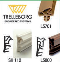
SH 112 L5000