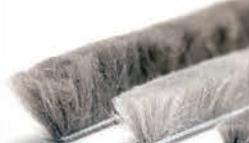
FLEXIBILNÍ KARTÁČEK POLY-BOND (PB) do „T“ drážky