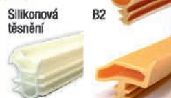
EURO 23 EURO 3216