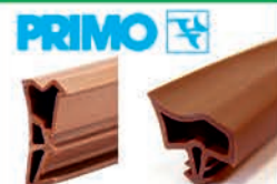
ACF 6000 H AC/EV 3967 KS