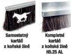
Samostatný kartáč z koňské žíně