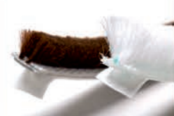
FLEXIBILNÍ SAMOLEPICÍ KARTÁČEK POLY-BOND (PB-HM)