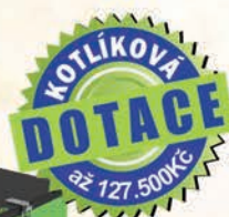
MultiBio 30 ES - na dřevěné pelety 9 - 90 KW

Video realizací a rozhovorů se zákazníky. Videotesty paliv.