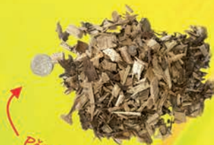
Pětikoruna Frakce paliva pro 4,9 kW.