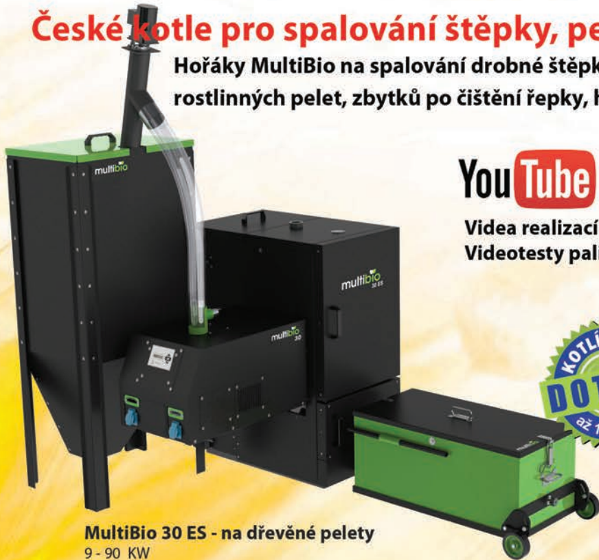
MultiBio 30 ES - na dřevěné pelety 9 - 90 KW