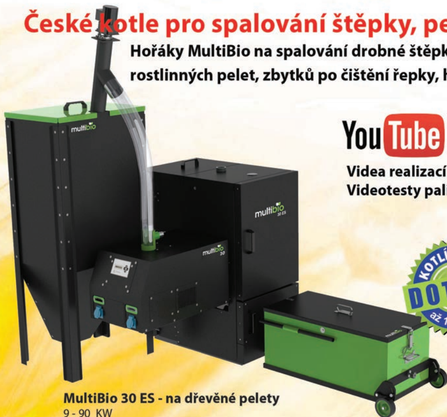
MultiBio 30 ES - na dřevěné pelety 9 - 90 KW