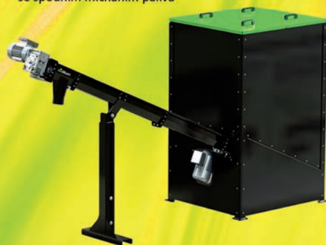
Násypka 1000 L se spodním mícháním paliva