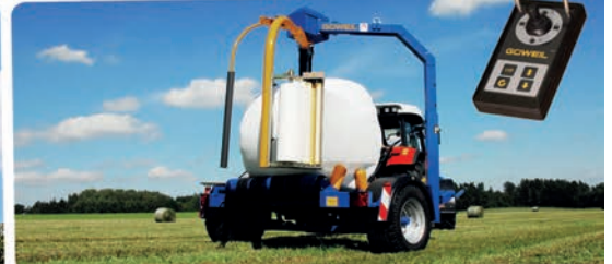
G3010 FARMER // OVÍJECÍ STROJ NA KULATÉ BALÍKY