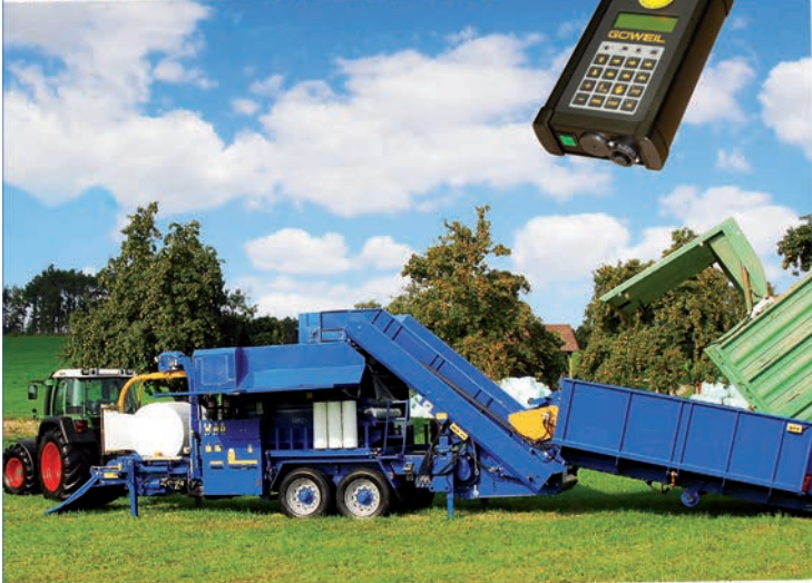
LT-MASTER // KOMBINOVANÉ LISOVACÍ A OVÍJECÍ STROJE