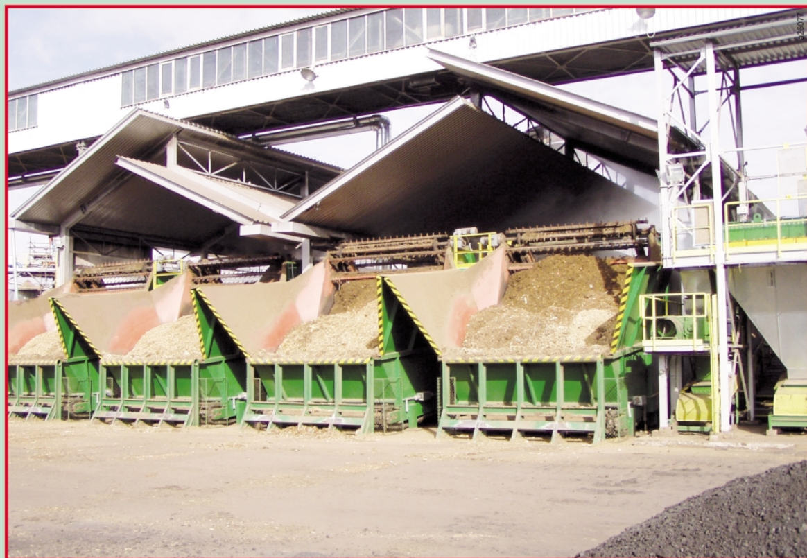
4 ks sušárny dřevní štěpky, typ TARPO BS-16 pro Plzeňskou teplárenskou a.s.

NA NÁKUP NAŠICH ZAŘÍZENÍ JE MOŽNÉ ZÍSKAT DOTACI.