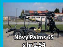
Nový Palms 6S s hr 2:54