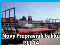
Nový Přepravník balíků PLT 14