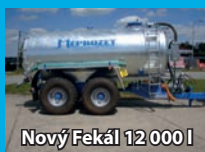
Nový Fekál 12 000 l