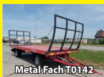
Metal Fach T0142