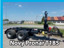
Nový Pronar T185