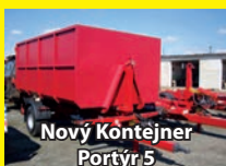
Nový Kontejner Portýr 5