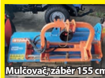
Mulčovač, záběr 155 cm