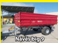
Návěs big 9