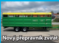
Nový přepravník zvířat