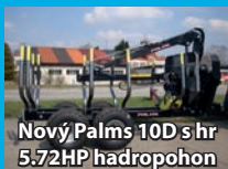
Nový Palms 10D s hr 5:72HP hadropohon