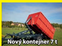
Nový kontejner 7 t