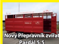
Nový Přepravník zvířat Pardál 5,5

AGRO LÍPA s.r.o. Havlíčkův Brod - Letiště • www.agrolipa.cz • Tel.: 777 090 118, 777 988 999