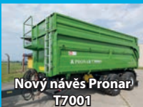
Nový návěs Pronar T7001