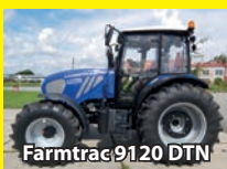
Farmtrac 9120 DTN