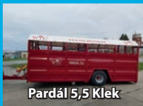
Pardál 5,5 Klek