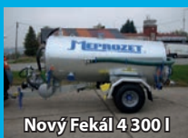
Nový Fekál 4 300 l