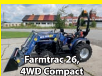
Farmtrac 26, 4WD Compact