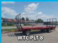
WTC PLT 8

Prodej NOVÝCH STROJŮ SKLADEM se zárukou a dopravou až k vám tel. 777 090 118