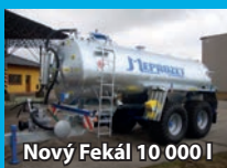
Nový Fekál 10 000 l