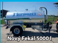
Nový Fekál 5000 l