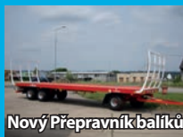
Nový Přepravník balíků