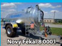
Nový Fekál 8 000 l

AGRO LÍPA s.r.o. Havlíčkův Brod - Letiště • www.agrolipa.cz • Tel.: 777 090 118, 777 988 999