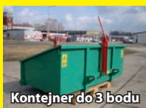
Kontejner do 3 bodu