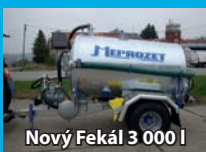
Nový Fekál 3 000 l