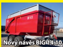
Nový návěs BIG 4,10