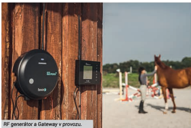
RF generátor a Gateway v provozu.