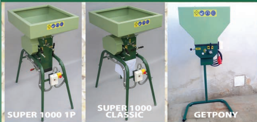
SUPER 1000 1P