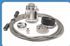
Špičkové tenzometry POWERCELL®PDX®