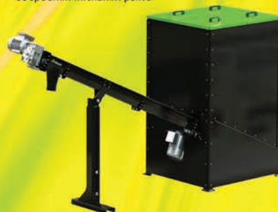
Násypka 1000 L se spodním mícháním paliva