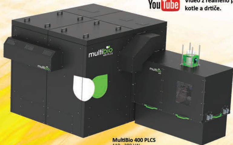
MultiBio 400 PLCS 110 - 380 kW

YouTube Video z reálného provozu kotle a drtiče.