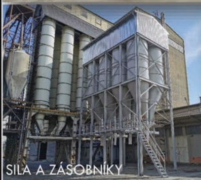
SILA A ZÁSOBNÍKY