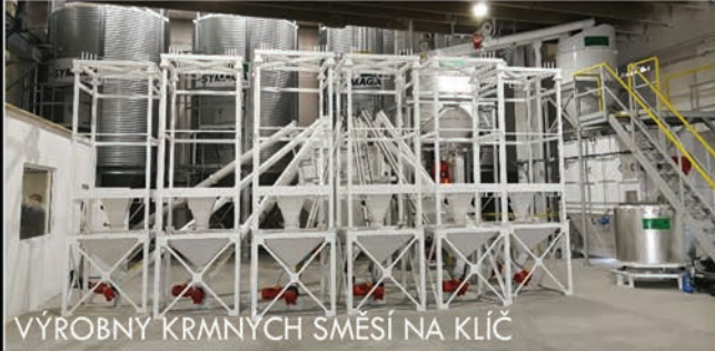
VÝROBNY KRMNÝCH SMĚSÍ NA KLÍČ